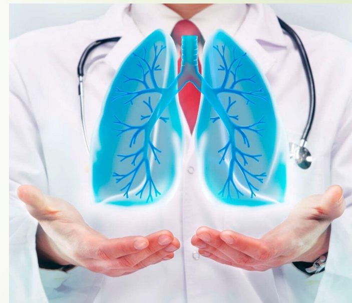
ВОССТАНОВЛЕНИЕ и ПРОФИЛАКТИКА КОРОНАВИРУСНОЙ ИНФЕКЦИИ