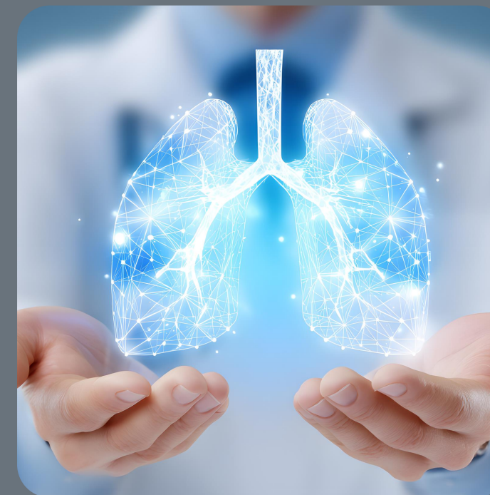
ВОССТАНОВЛЕНИЕ И ПРОФИЛАКТИКА КОРОНАВИРУСНОЙ ИНФЕКЦИИ

Оздоровительные программы учебно-оздоровительного центра «Икша» предлагают индивидуальные решения для улучшения самочувствия, каждая из программ нацелена на конкретный результат: